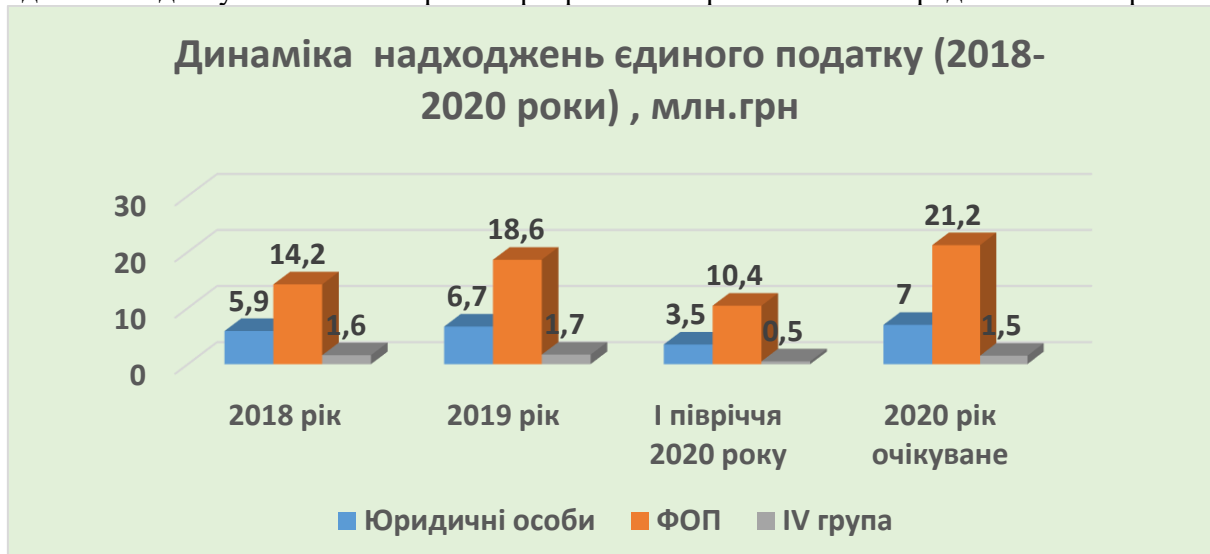
Рис. 2. Динаміка надходжень єдиного податку за 2018-2020 роки.

Так, спрощеною системою оподаткування скористалися 618 платників, у тому числі 100 юридичних осіб (III група), 480 фізичних осіб-підприємців (I-III групи) та 38 сільськогосподарських товаровиробників (IV група). Частка надходжень єдиного податку в структурі податкових надходжень зростає з 7,1% у 2018 році до 8,1 у 2020 році (очікуване). Зростання надходжень цього податку зумовлене збільшенням прожиткового мінімуму (для розрахунку єдиного податку платників I групи), мінімальної заробітної плати (для розрахунку єдиного податку платників II групи) та кількості платників, які обрали спрощену систему оподаткування та сплачують єдиний податок до місцевого бюджету. Динаміка надходжень єдиного податку за 2018-2020 роки в розрізі категорій платників представлена на рис. 2.